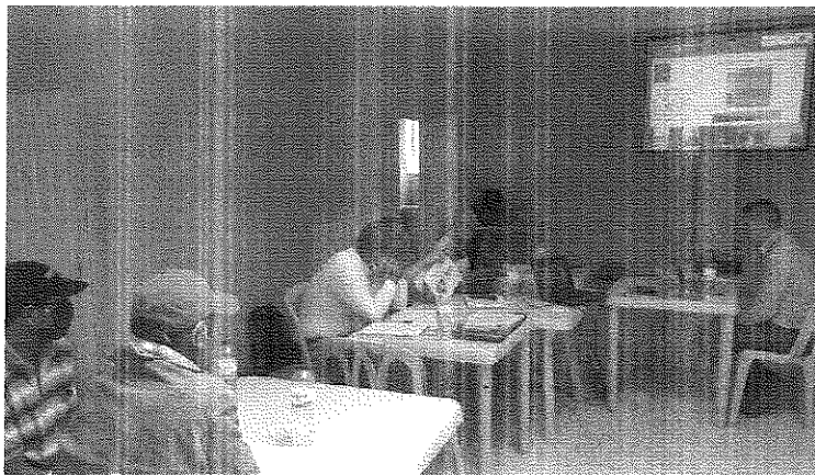
ANEXO 2. Reunión de la asamblea de manera semipresencial y virtual